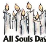
All Souls Day