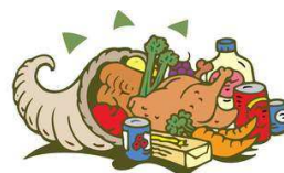
Thanksgiving Food Drive

Once again we will be accepting can food and dry goods (no glass) for our Thanksgiving Food Drive. All food collected will go to the Sisters of The Renewal on Bainbridge Avenue. Last day for our Food Drive is Sunday, November 18 th , 2018. Thank you!