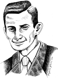
Beato Carlos Manuel Rodríguez Santiago